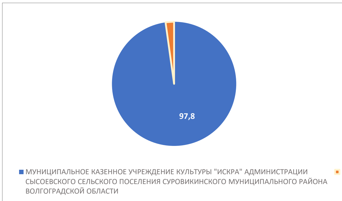
Рисунок 5 – Интегральный показатель по критерию «Удовлетворенность условиями оказания услуг»

По пятому критерию «Удовлетворенность условиями оказания услуг» МУНИЦИПАЛЬНОЕ КАЗЕННОЕ УЧРЕЖДЕНИЕ КУЛЬТУРЫ "ИСКРА" АДМИНИСТРАЦИИ СЫСОЕВСКОГО СЕЛЬСКОГО ПОСЕЛЕНИЯ СУРОВИКИНСКОГО МУНИЦИПАЛЬНОГО РАЙОНА ВОЛГОГРАДСКОЙ ОБЛАСТИ набрало 97,8 балла (Рис. 5)