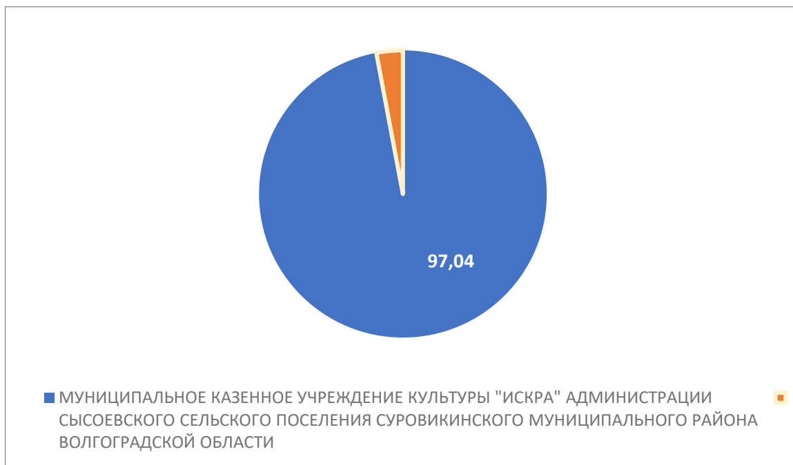
Рисунок 4 – Интегральный показатель по критерию «Доброжелательность, вежливость работников организации»

По четвертому критерию «Доброжелательность, вежливость работников организации» МУНИЦИПАЛЬНОЕ КАЗЕННОЕ УЧРЕЖДЕНИЕ КУЛЬТУРЫ "ИСКРА" АДМИНИСТРАЦИИ СЫСОЕВСКОГО СЕЛЬСКОГО ПОСЕЛЕНИЯ СУРОВИКИНСКОГО МУНИЦИПАЛЬНОГО РАЙОНА ВОЛГОГРАДСКОЙ ОБЛАСТИ набрало 97,04 балла (Рис. 4)