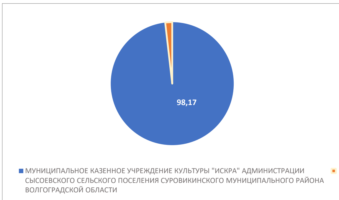
Рисунок 2 – Интегральный показатель по критерию «Комфортность условий предоставления услуг»

По второму критерию «Комфортность условий предоставления услуг» МУНИЦИПАЛЬНОЕ КАЗЕННОЕ УЧРЕЖДЕНИЕ КУЛЬТУРЫ "ИСКРА" АДМИНИСТРАЦИИ СЫСОЕВСКОГО СЕЛЬСКОГО ПОСЕЛЕНИЯ СУРОВИКИНСКОГО МУНИЦИПАЛЬНОГО РАЙОНА ВОЛГОГРАДСКОЙ ОБЛАСТИ набрало 98,17 балла (Рис.2)