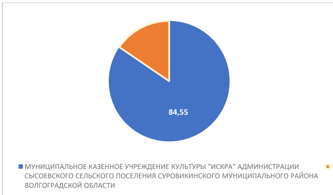
Рисунок 1 – Интегральный показатель по критерию «Открытость и доступность информации об организации культуры»

По первому критерию «Открытость и доступность информации об организации культуры» МУНИЦИПАЛЬНОЕ КАЗЕННОЕ УЧРЕЖДЕНИЕ КУЛЬТУРЫ "ИСКРА" АДМИНИСТРАЦИИ СЫСОЕВСКОГО СЕЛЬСКОГО ПОСЕЛЕНИЯ СУРОВИКИНСКОГО МУНИЦИПАЛЬНОГО РАЙОНА ВОЛГОГРАДСКОЙ ОБЛАСТИ набрало 84,55 балла (Рис.1)